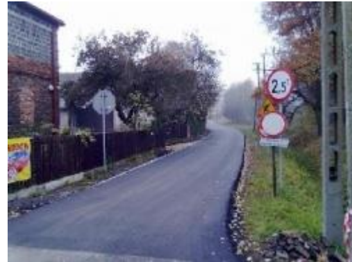
ul. Bijasowicka po remoncie