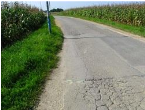
Majowa przed remontem