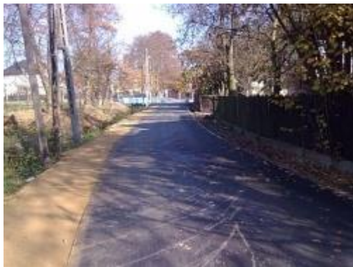
ul. Krupnicza w trakcie remontu