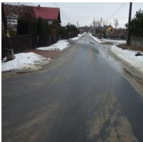
ul. Lipcowa po remoncie