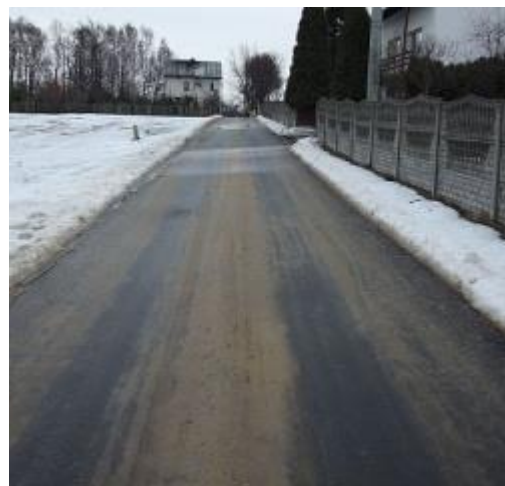
boczna ul. Bijasowicka do ul. Lipcowej po remoncie