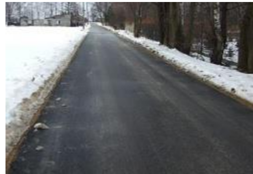
ul. Krupnicza po remoncie