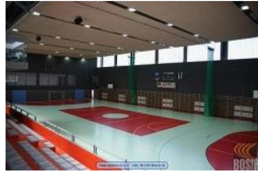
Hala po remoncie