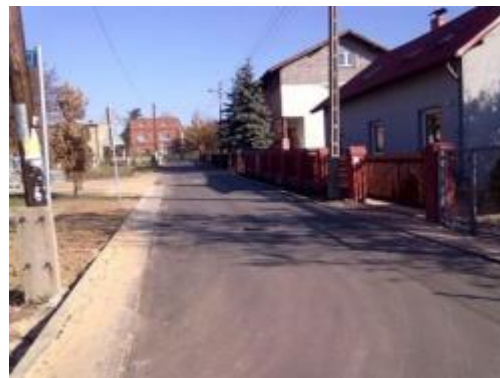
ul. Budzyńska po remoncie