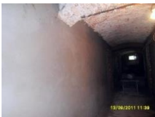
W trakcie remontu