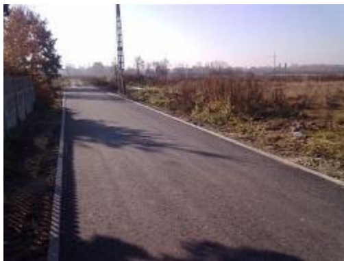
ul. Przyjaźni po remoncie