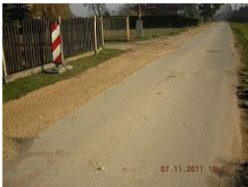
W trakcie remontu