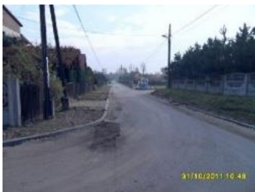
ul. Żywiczna w trakcie remontu