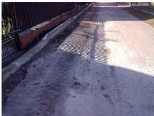
W trakcie remontu