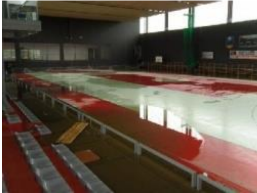
Hala przed remontem