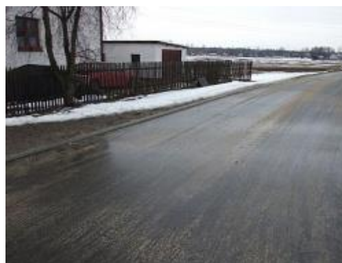
ul. Żywiczna po remoncie