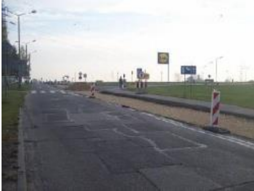
W trakcie remontu