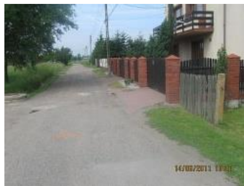
ul. Starowiślana po