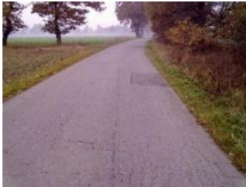
ul. Bijasowicka przed remontem