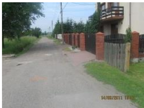
ul. Starowiślana przed